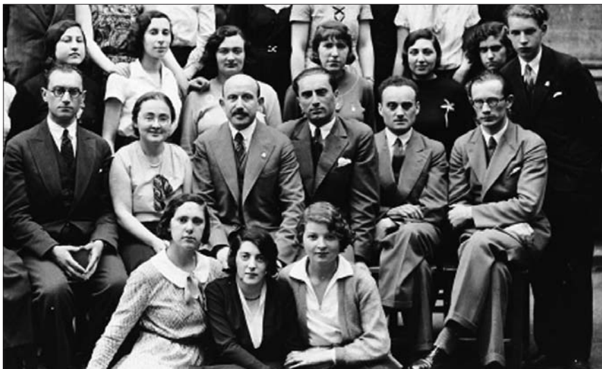
Учителя и ученики рижской школы «Эзра». 1930-е годы