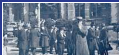
Latvijas Universitātes atklāšana 1919. gada 28. septembrī.

LU (līdz 1923. gadam Latvijas Augstskola) dibināta 1919. gada 28. septembrī. Tā bija skaista, saulaina diena, un vecā Rīgas Politehniskā institūta ēka (tagadējā LU ēka Raiņa bulvārī 19) bija greznota zaļu lapu vītņēm un sarkanbaltsarkaniem karogiem. Uz augstskolas dibināšanas svētkiem pulcējās goda viesi – Tautas padomes un Ministru kabineta locekļi, armijas augstākie komandieri, diplomātiskais korpus,