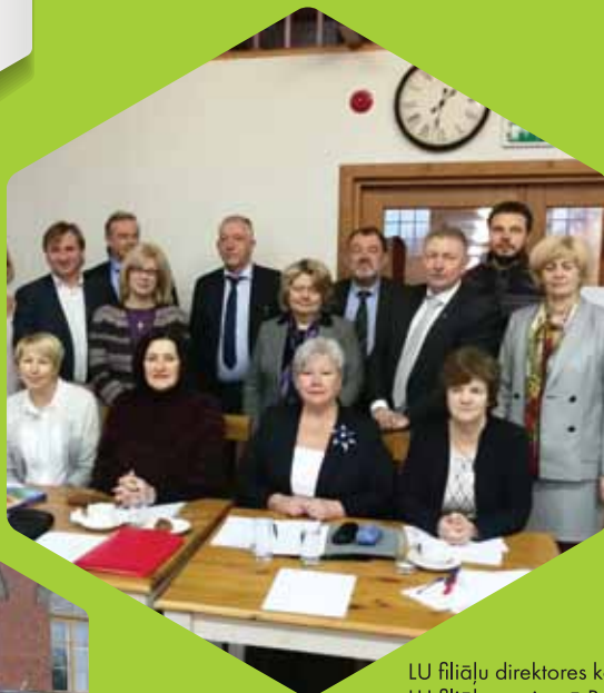
LU filiāļu direktores kopbildē ar LU vadību LU filiāļu seminārā Ratniekos (10.01.2018.)