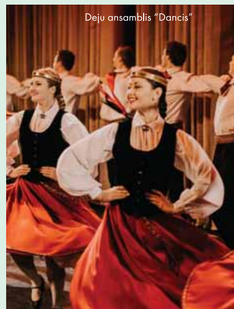
Deļu ansamblis "Dancis"

Kolektīvā darbojas gan jauniešu sastāvs, gan vidējās paaudzes deļotāji, kuri "Danci" deļo jau 25 gadus un vairāk. Deļu ansamblis "Dancītis" sevī apvieno gan jauniešus, gan vidējās paaudzes deļotāļus. 2017. gada nogalē Latvijas Universitātes deļotāju saimei pievienojās deļu ansamblis "Pērle", kas apvieno jaunus un talantīgus jauniešus, kuri vēlas sevi attīstīt un pilnveidot latviešu skatuviskās deļas mākslas žanrā. "Pērle" piedalās Rīgas pilsētas un Latvijas mēroga pasākumos, regulāri iestudē jaunas koncertprogrammas.