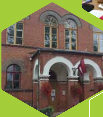
LU Kuldīgas filiāles ēka.