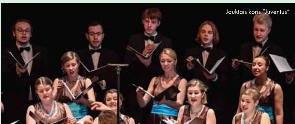
Jauktais koris "Juventus"