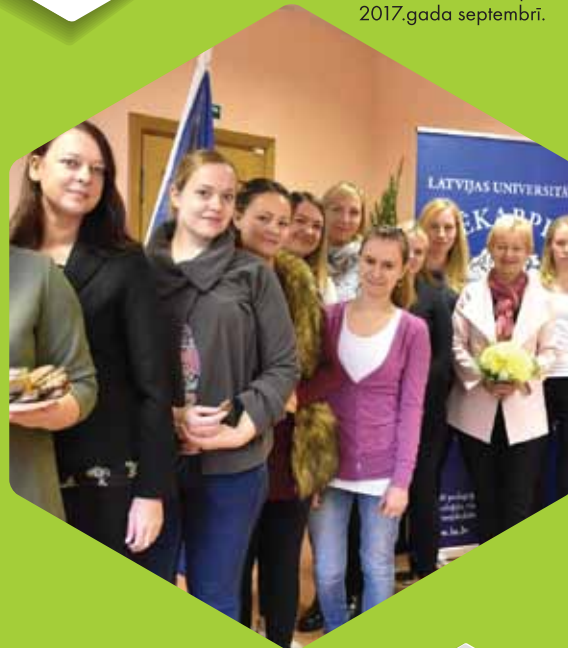
LU Jēkabpils filiālē 1. kurss uzsāk studijas 2017.gada septembrī.