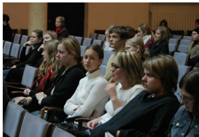
Klausītāji Lielajā aulā