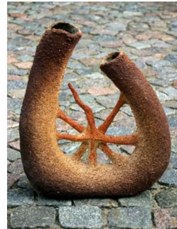
L. Biele "Saulesraksti"

Turpinot 2001. gadā aizsāktu tradīciju "Meklējam talantus starp "Vāpes" talantiem", šoruden dekoratīvās keramikas izstādi papildina vāpietes Unas Dževečkas