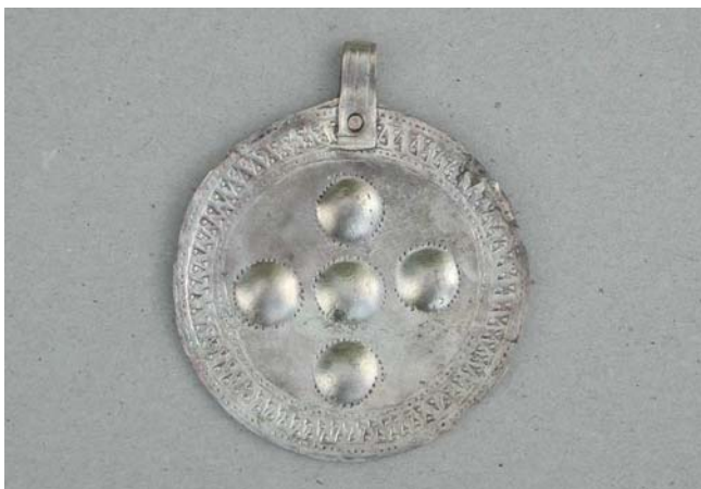
Kaklarota no 12 šādiem sudraba piekariņiem 15. gs. greznajusi kādu Užavas apkārtnes zemnieci. Pēc vairāk nekā 500 gadiem to "gaismā cēlušī" Vēstures un filozofijas fakultātes studenti

Vēstures bakalaura 2. kursa studente MAIJA VILCE , 3. kursa studente LAURA LĒGERE