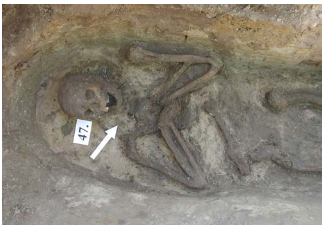
Tā nu tas izskatās, kad apbedījuma atfiršanas darbs gandrīz pabeigts. Šis 15.-16. gs. uzavietis vēl tikai gatavojas "pāstāstīt" par savu vecumu, dzīves veidu, drānām un līdzdotajām lietām...