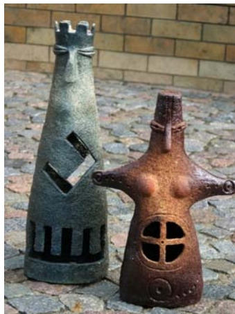
A. Lase "Mēness veda Saules meitu"

24. novembrī galerijā "Bastejs" tika atklāta kārtējā LU tautas lietīšķās mākslas studijas "Vāpe" izstāde "Zīmes", kas apskatāma vēl līdz 5. decembrim.