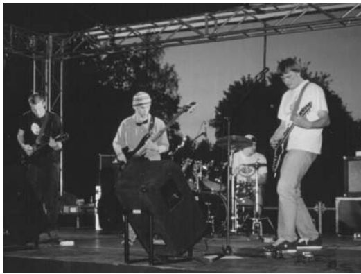
Koncerts LU Sociālo zinātņu fakultātē

Grupa apliecinājusi sevi uz dažādām Latvijas skatuveņiem: "Stage number one" - 2003.,