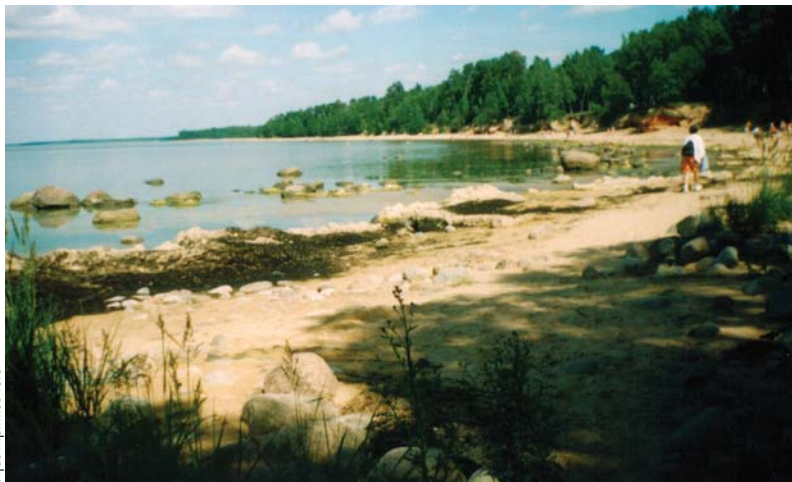
Viens no Vidzemes akmeņainās jūrmalas brīnumiem - sājā ūdens tuvumā vietām aug zāle