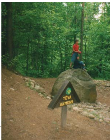
Tūristi vēlas izmēģināt, vai šis akmens tieši viņiem izstaro siltumu

Tika uzaicinātas arī īpašām spējām apveltītas sievietes no dažādiem Latvijas novadiem un vaicāts, ko viņām stāsta Ak-meņu ieleja. Iepriekš nesazinā-jušās, zintnieces vēstīja vienu un to pašu: šeit Namejs un viņa zemgaļu karavīri esot cīnījušies ar vācu krustnešiem.