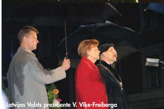
Latvijas Valsts prezidente V. Vīķe-Freiberga