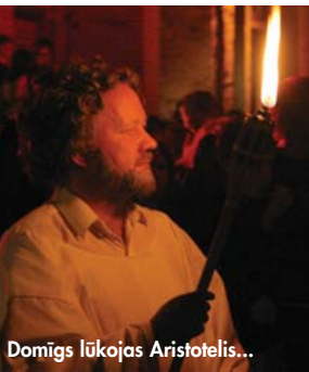
Domīgs lūkojas Aristotelis...

dzīves pieredzi, jo kas gan vēl cits tā spēj apvienot studentus".