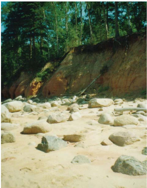
Viņas Apinītes foto