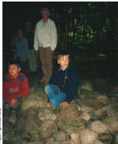
Akmeņu krāvumi Pokaiņos gaida pētniekus

Kad tiku tikām baudīta jūra, iegriežamies Limbažos. Ir vērts redzēt, kā te glāb senās