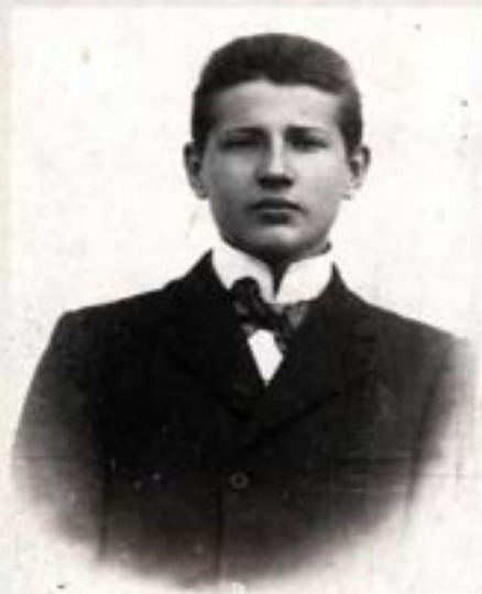
/ 3. foto /