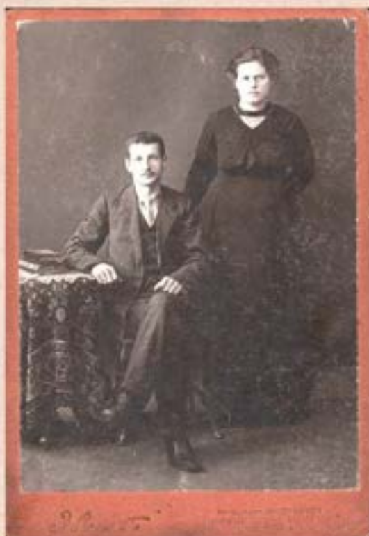
Lancmanis un dzīves biedrs. Lejasciemē 1915.g.