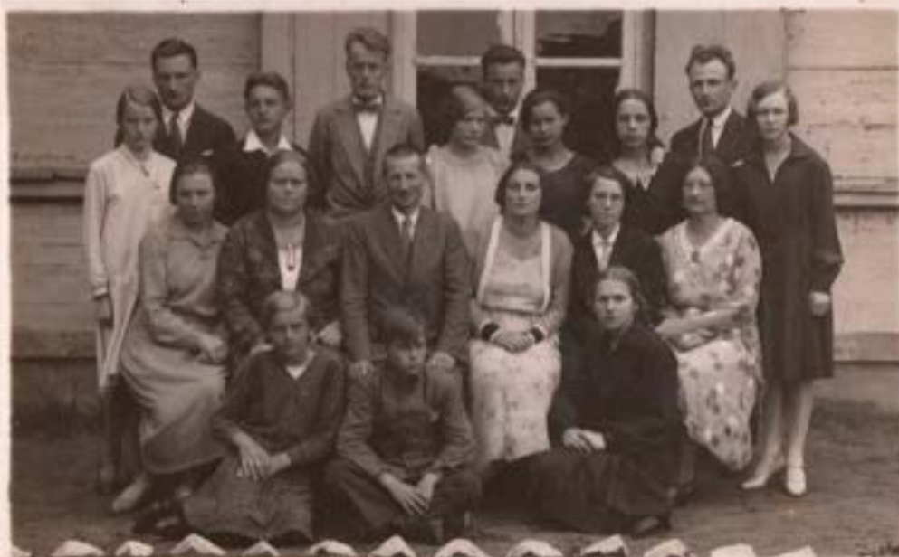
Rīgas Strazdumuižas skolā - 1933.g.