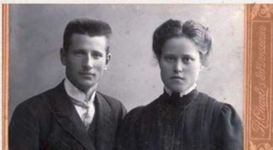
Lancmanis Pēterpilī 1917.g.

Apkārtnes mācība, aplūkodama parādības no v i s d a ž ā - d ā k i e m v i e d o k ļ i e m, jau ar to veicina skolēnu kri- tikas spējas, asina daudzpusīgu skatu. Skolēnu brīvā stāstīšana kritikas vingrināšanu padara par nepieciešamu. Nav reti gadīju- mi, kur skolēnu spilgtāki pieredzējumi un mājnieku ziņas modina īstus stāstīšanas "plūdus". Tur klausītāju kritiskas atziņas: "nav par stundas tematu", "varēja īsāk, tikai galveno teikt", la- bi atvieglo darba pavadīšana ieturēšanu. Tas tomēr prasa lielu taktu, rūpīgu saudzību no skolotāju puses, lai neaizvainotu jutī- gos "referentus". Svarīgs brīdis no šī viedokļa ir pārrunu kop- sevilcums. Pārrunās minēto faktu īsa atzīmēšana uz klasas tāpe- les, sistematizēšana, salīdzināšana, vērtīgākā izcelšana, jaunu, līdz tam svešu ieguvumu uzmeklēšana - ir vērtīgi etapi lietišķas kritikas spēju vingrināšanā. 18