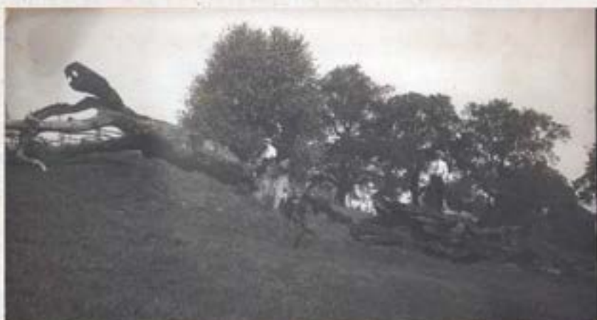
/ 9. foto /

Sīmanēnu svētais upurozols Valmieras tuvumā. Ozola apkārtmērs 8\frac{1}{2} m. Ar 2 apzīmēts dzejnieks Rieteklis. Upurozols nodedzināts 1920. gadā Vasaras svētkos. Sk. nākošo uzņēmumu.