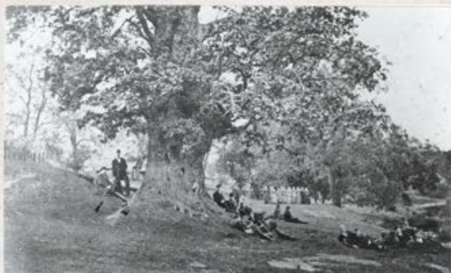
/ 8. foto /

Lenčmanis ieteic mums pārbaudīt tos dzinulus, kas spiež angļu fabrikantus Rīgse nomalē piemūrēt ozoliem dobumus.