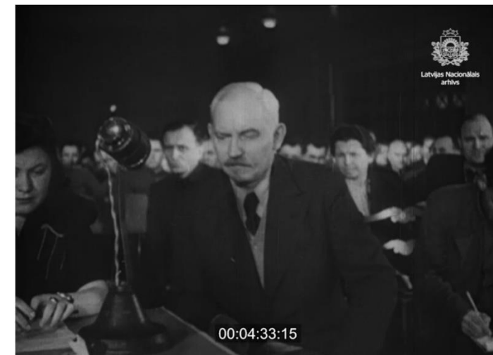
Kinožurnāls «Padomju Latvija», 1946, Nr. 8 (Speciālizlaidums).

Lit.: Tiesas prāva par vācu fašistisko iebrucēju laundarībām Latvijas, Lietuvas un Igaunijas PSR teritorijā / Cīņa, 1946, 30. janv. (Nr. 24); Grūtups, A. (2007). Ešafots. Rīga: Atēnā.