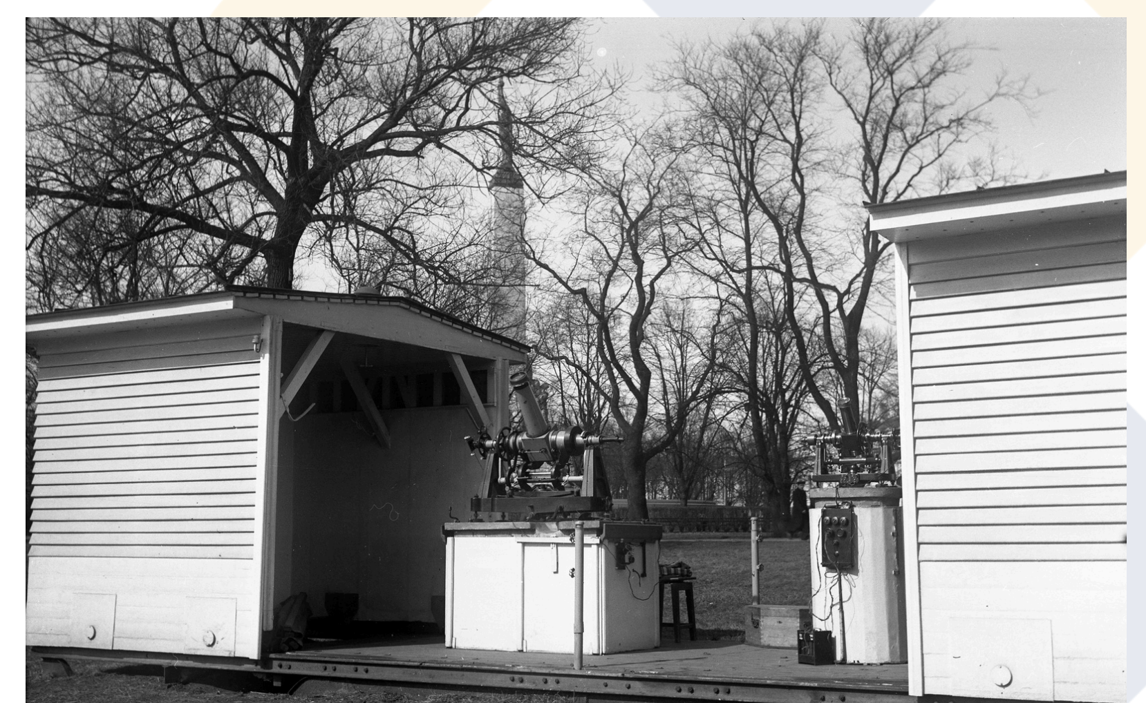
LU Astronomiskās observatorijas novērojumu paviljons atvērta veidā sagatavots darbam. LU Muzeja krājums