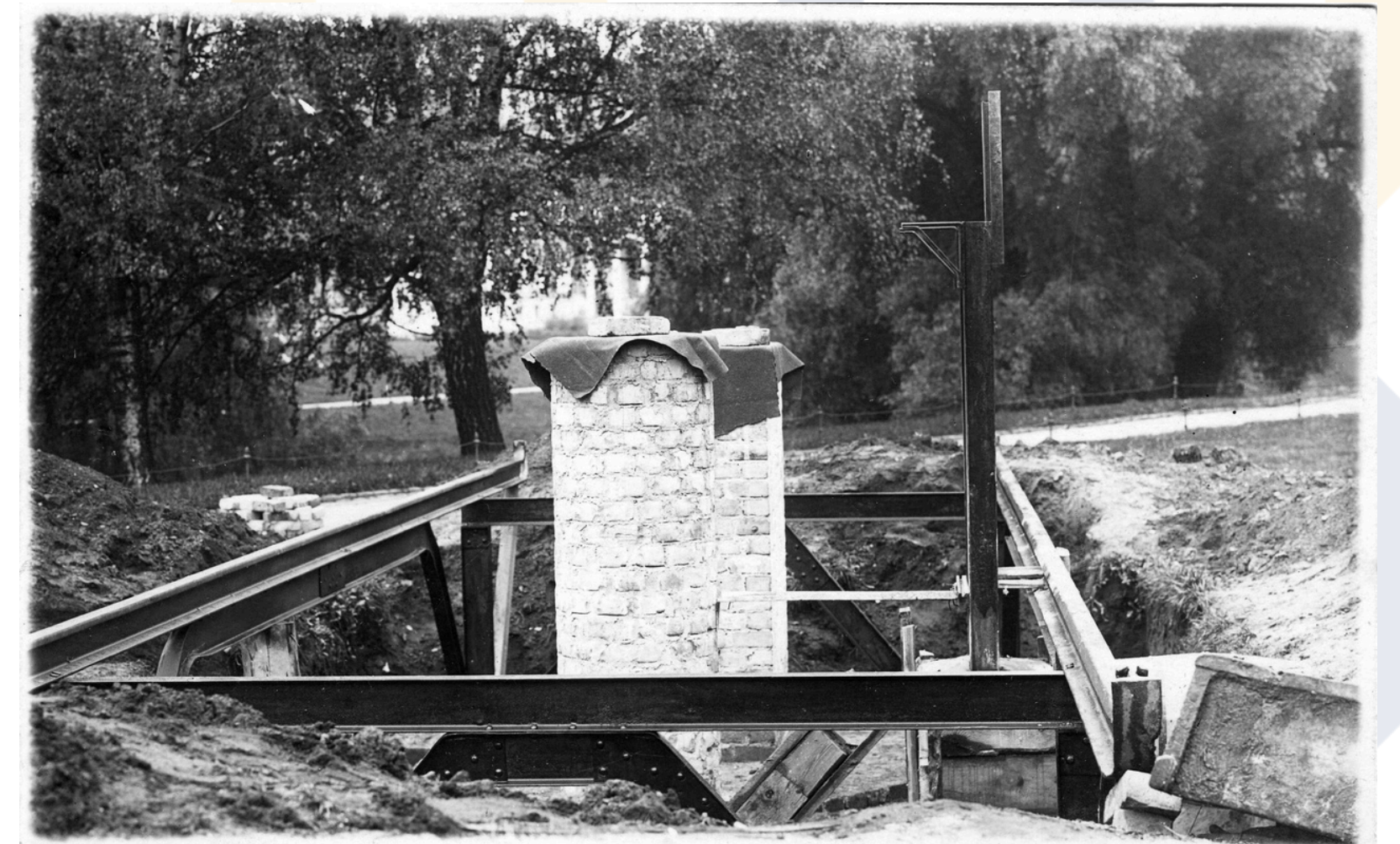
Novērojumu paviljona būvniecības darbi, 1926.