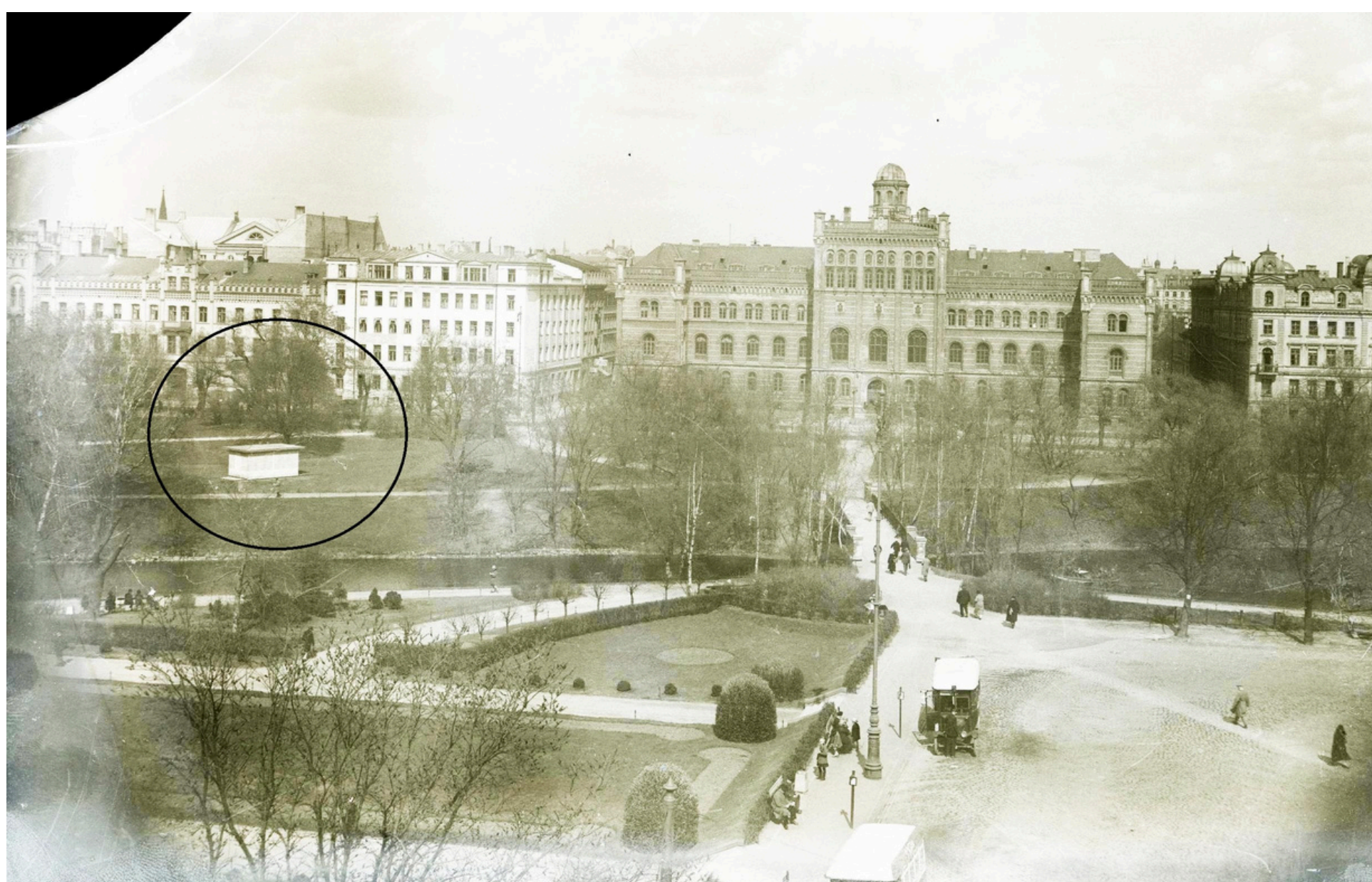
Latvijas Universitātes Astronomiskās observatorijas laika dienesta novērojumu paviljona atrašanās vieta, attēls uzņemts ap 1930. gadu. LU Muzeja krājums

Novēroja ar speciālu teleskopu (pasāžinstrumentu), noteica laika momentu, kad zvaigzne sasniedz noteiktu virzienu debess dienvidu pusē – debess meridiānu. Novērotāja reģistrētos laika momentus pierakstīja hronogrāfs. Pēc tam hronogrāfa datus salīdzināja ar pulksteņu sekunžu signāliem un regulēja tos. Novērojumi paviljonā notika līdz 1959. gadam, pēc tam laika dienests tika pārcelts uz LU Botāniskā dārza teritoriju. Vēlāk paviljonu nojauca un uzstādīja tēlnieces Aleksandras Briedes veidoto skulptūru „Mana zeme”. Paviljons atradās dažus metrus no meitenes bronzas skulptūras uz Operas pusi.