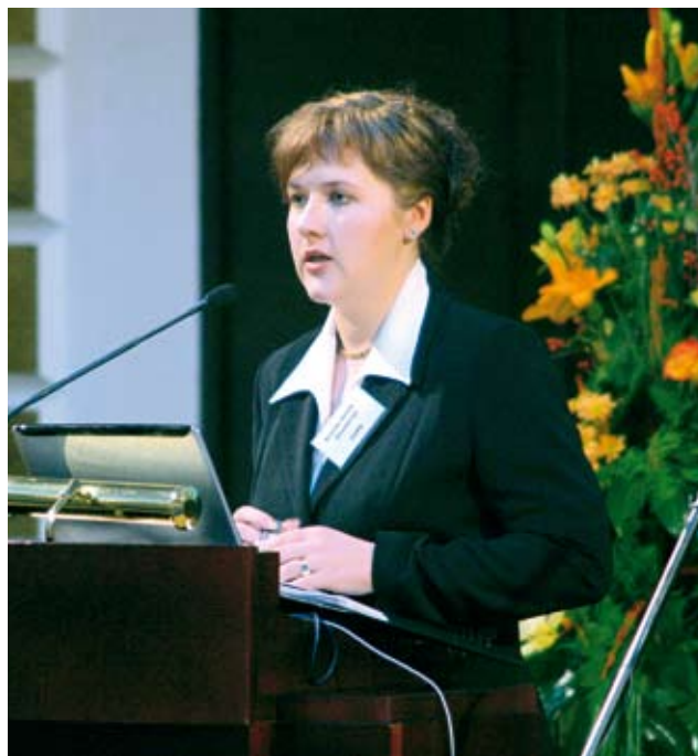
Konferencē The Harmonization of Law in the Baltic Sea Region After the Expansion of the European Union

naudu to nevar atsvērt. Jānāk cilvēkam, kas pats to grib, nevis jāseko tam, ko saka mamma vai tētis.