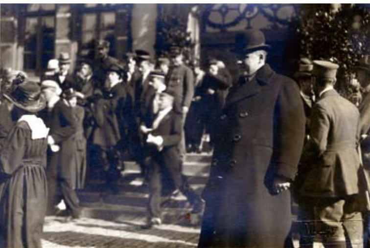
Latvijas Universitātes atklāšana 1919. gadā

studentus, veidojot viņos piederības izjūtu savai augstskolai un lepnumu par tās vēsturi.