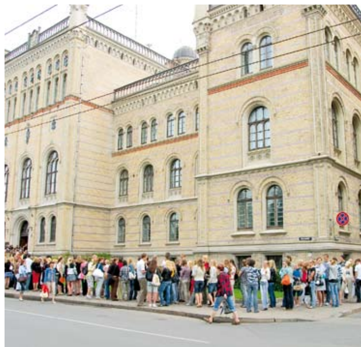
Stāvēt rindā pirmajā uzņemšanas dienā nav nozīmes

Stāvēt garajā rindā, iespējams vienīgi iepazīties ar varbūtējiem nākamajiem kursabiedriem, bet veiksmīgāk iestāties Universitātē tas nepalīdzēs!