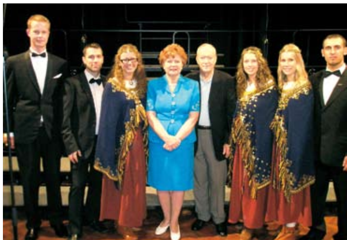
Pēc kopkora koncerta ar V. Viķi-Freibergu