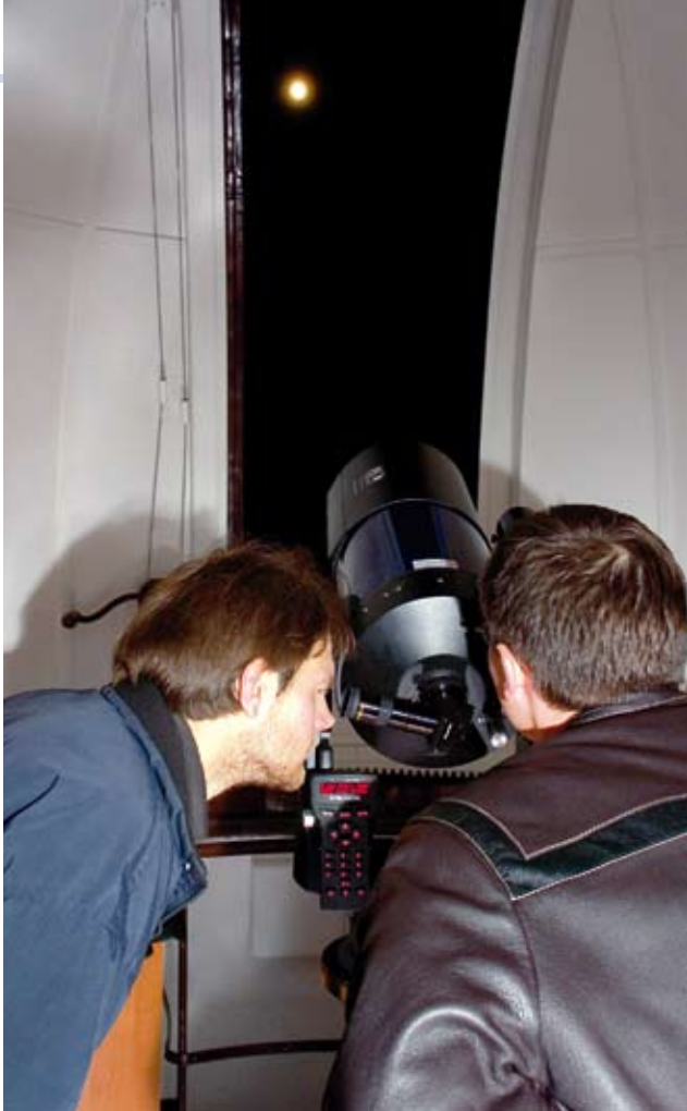
LU astronomiskajā tornī turpinās debess demonstrējumi

miljons gadus. Par to astronomi ir pilnīgi droši,» skaidro I. Vilks, «šādi atklājumi vairāk atbilst dabas izziņai, un to praktiskā lietošana nav tik augsta.» Latvijā atklāti un izpētīti vairāki simti šādu zvaigžņu, kas ir vairāku gadu desmitu ilgu pētījumu rezultāts.