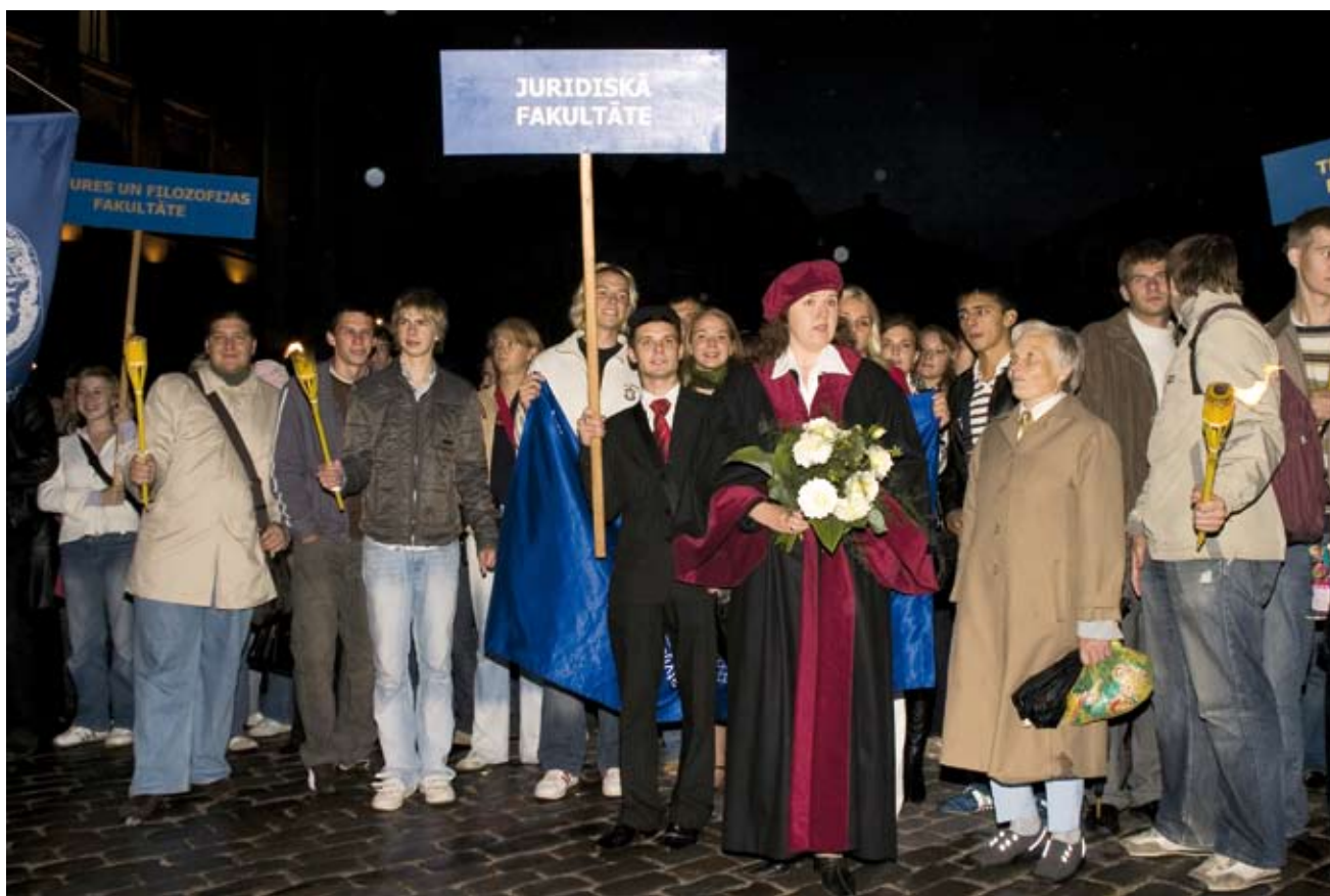
Ar studentiem Jaunā studenta svētkos (Aristoteļa svētkos) 2007 Doma Laukumā