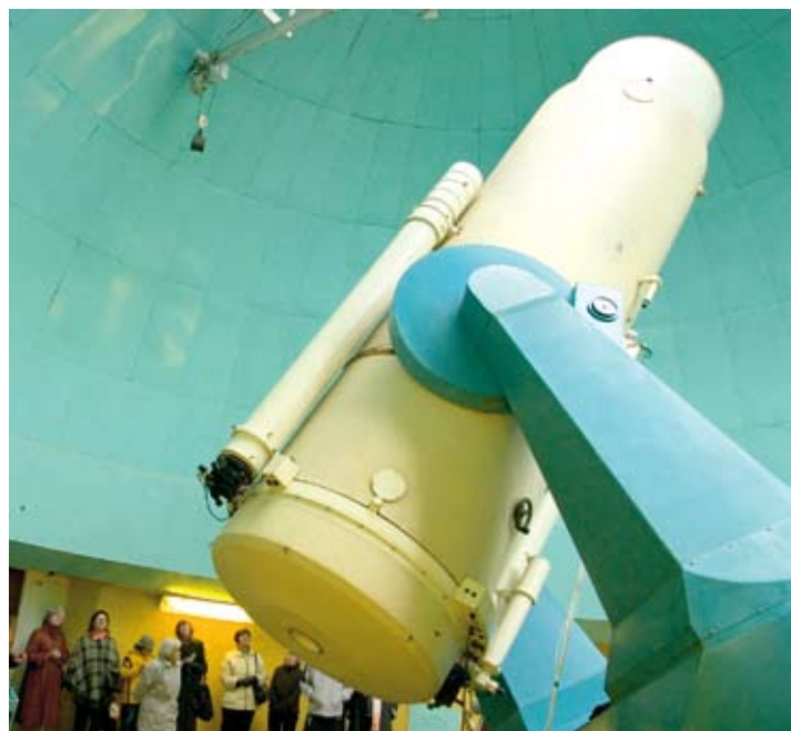
Šmidta teleskops LU Astronomijas institūta astrofizikas observatorijā Baldones Riekstukalnā