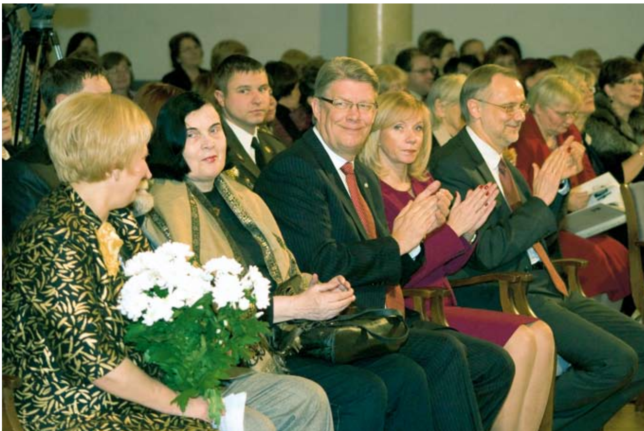
Enciklopēdijas «100 LATVIJAS SIEVIETES kultūrā un politikā» prezentācija notika 12. decembrī LU Lielajā aula

Tad, kad sieviete gūst ļoti spilgtu izpausmi kultūrā, arī tiešāka vai netiešāka politiskā ietekme parādās.