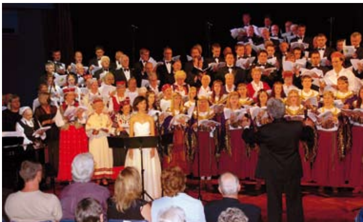
Kopkora koncerts Sidnejā

Publikā gan vairāk bija vecāka gadagājuma ļaudis, bet bija arī jaunieši. Dziedāja līdzī «Pūt vējiņus», savukārt tie, kas jau agrāk dziedājuši koros, zināja arī «Jāņu vakaru», «Gaismas plī» un citas dziesmas.