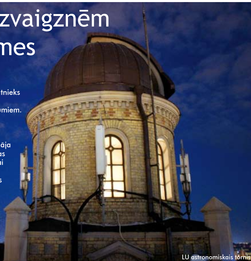
LU astronomiskais tornis

Pagājuši jau 400 gadi, kopš izcilais zinātnieks Galileo Galilejs pavērsa sava teleskopa objektīvu pret zvaigžņotās debess plašumiem. Cilvēce var lepoties ar šajā laikā sasniegto, tāpēc arī Apvienoto Nāciju Organizācijas 62. Ģenerālā asambleja pagājušajā rudenī 2009. gadu pasludināja par Starptautisko Astronomijas gadu. Tas tiek rīkots, sadarbojoties Starptautiskajai Astronomijas savienībai un Apvienoto Nāciju Organizācijas Izglītības, zinātnes un kultūras organizācijai UNESCO. Kā zināms, Latvija ir abu šo starptautisko organizāciju dalībvalsts, tāpēc Latvijas astronomu saime ir nolēmusi ar savām iniciatīvām pievienoties kolēģiem no citām pasaules valstīm un piedāvāt tās Latvijas sabiedrībai.