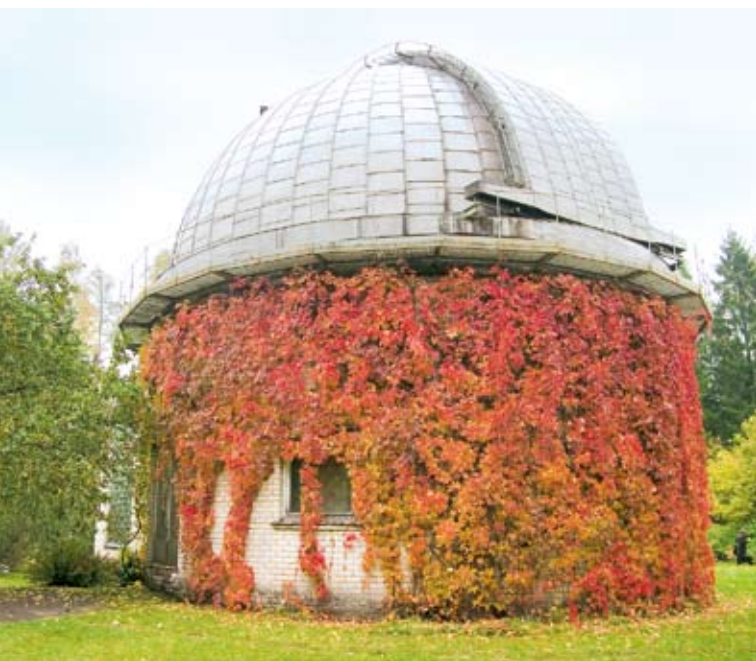
LU Astronomijas institūta astrofizikas observatorija Baldones Riekstukalnā