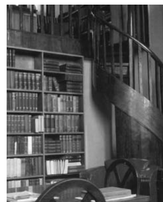
Sv. Klimenta Ohridska Sofijas universitātes bibliotēka

Salīdzinot ar citām postsociālistiskajām valstīm, esam ceļā pašā sākumā. Piemēram, Bulgārijā ir iznākušas jau vairākas mācību grāmatas reliģijas pedagogijā, kamēr Latvijā darbs pie mācību literatūras un programām oficiālā valsts līmenī tikai sākas. Simpozijā smēlos idejas mūsu pieejas izstrādāšanai. Ja Austrumu reliģijas pedagogijā lielāks uzsvārs likts tieši uz katras konkrētās Baznīcas mācību un tās pasniegšanu, Rietumos, pirmkārt, ir izteiktāka virzība uz