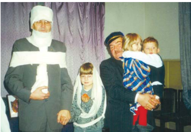
Ziemassvētku izklaides kopā ar bērniem un mazbērniem

PS. Internetā var iepazīties arī ar dažādām aktualitātēm, saistītām ar Fr! R!: www.home.lv/rusticana .