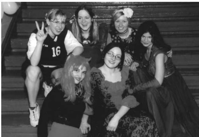
Korporāciju masku ballē "Aprīļa pilieni"