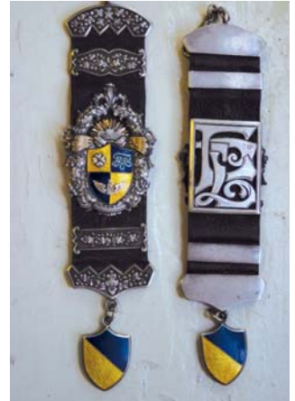
Pulkstenķēde - bircipfelis