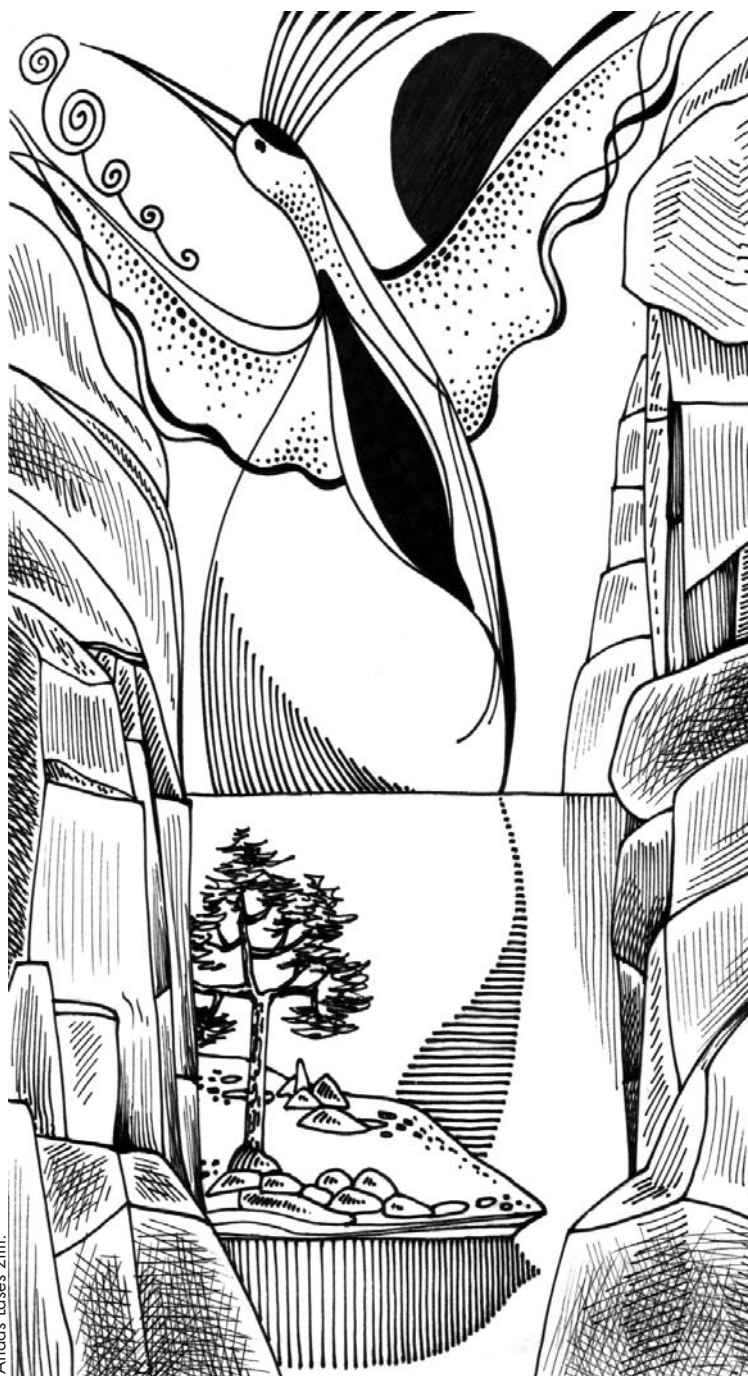
Andas Lases zīm.

Viņš baudīja mirkli. Novakare atnāca, šķiet, pārāk