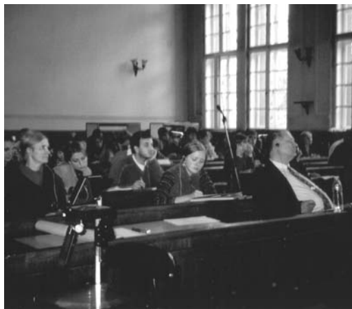
Skats uz simpozija auditoriju

- Doma organizēt šo semināru radās sadarbībā ar maniem vācu kolēģiem, un mēs centāmies atrast sponsorus. Esam ļoti pateicīgi Valteram Zenhau-