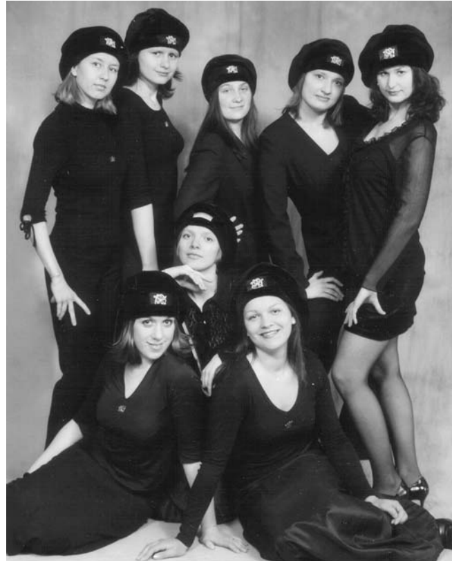
Pirmā no labās (stāv): Saiva kopā ar sava semestra imerietēm

Korporācijā bieži ir jāuzstājas auditorijas priekšā un visas lietas jāpasniedz skaisti un pacilāti. Piemēram: "Mīļās imerietes, šajā jaukā dienā mēs priecājamies satikties..." Man tas brīžiem liekas par daudz uzspēlētu, līdzīgi amerikāņu liekuļošanai. Nevienam, tikko no rīta piecēlies, taču nedomā: "Cik skaists un burvīgs lietu tiņš!" vai, izejot ārā, nesajūsminās par "atpirdzinošo un vel dzinošo rudens dvesmu". Manuprāt, cilvēki dažkārt pārspīlē un sadzejo kaut ko uz vietas. No rīta taču parasti domā par savu izskatu un to, kas viss šajā dienā ir jāizdara. Ja aiz loga spīd saule un čivina putni, kāds varbūt arī papriecājas, bet, ieraugot vēju, lietu un apmākušās debesis, neviens aiz sajūsmas gaisā nelec. Vari domāt,