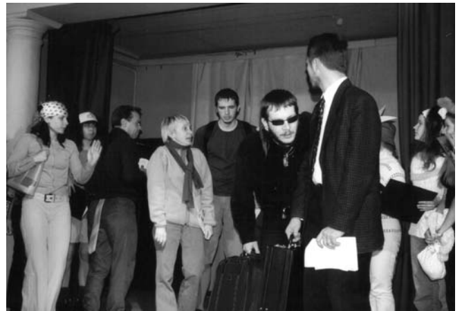
Vinnija Pūka ekspedīcija uz Ziemeļpolu: teātri latīņu valodā spēlē LU docētāji un studenti

Runājot par Romas mantojuma klātbūtni, jaušamo un nemanāmo, pieminēšanas vērtā ir konferences kultūras programma, kas pasākumam piešķīra īpašu auru. Savdabīgā veidā tika interpretēts Alana Milna jau