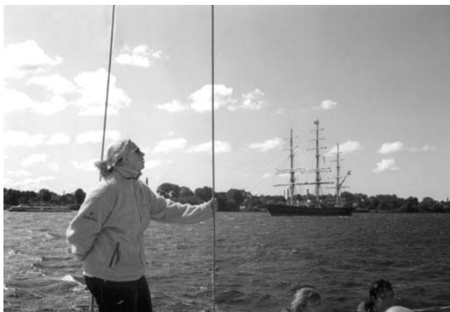
Daugavā "Cutty Sark" regates laikā