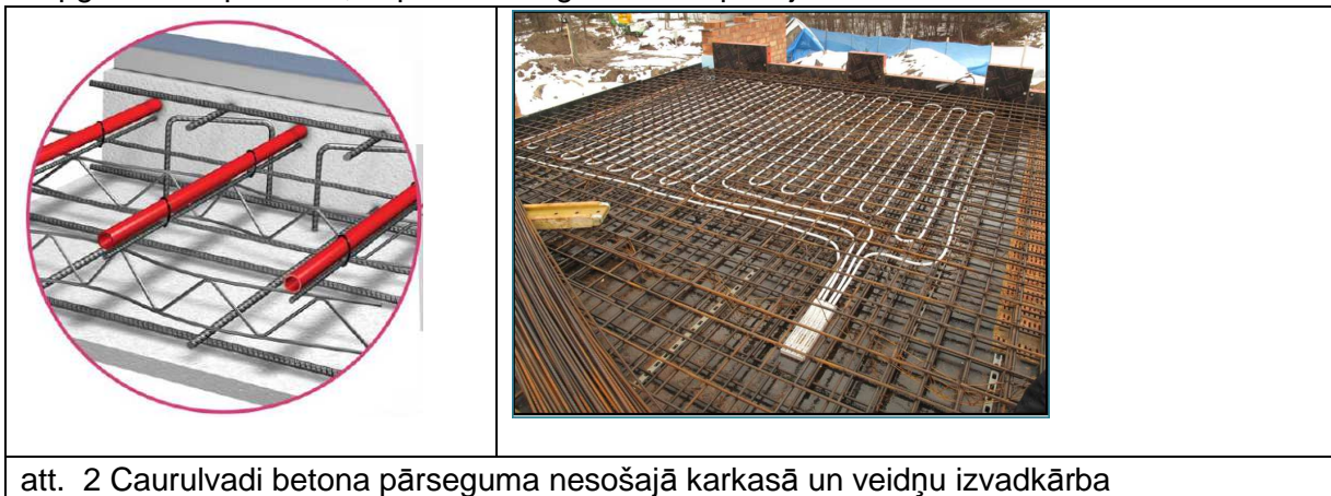
att. 2 Caurulvadi betona pārseguma nesošajā karkasā un veidņu izvadkārba

Aukstumnesēja grafiks – 14/17°C, ar paaugstinājumu no VAS, atbilstoši āra gaisa rasas punktam, lai samazinātu kondensāta izkrišanas iespēju atvērtu logu gadījumā. Aukstumnesēja sagatavošana jāveic centralizēti, izmantojot trīsceļu vārstu ar pievadu, nodrošinot atpakaļgaitas aukstumnesēja piejaukšanu turpgaitai, pēc iespējas paaugstinot turpgaitas temperatūru, tā panākot augstāku kompresijas iekārtu darbības efektivitāti.